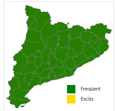
Mapa de distribució

COMPORTAMENT: forma grups nombrosos i es pot trobar des de la part fonda fins a la superficial de la columna d'aigua.